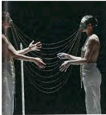
Quand les dieux ne nous abandonnent pas.