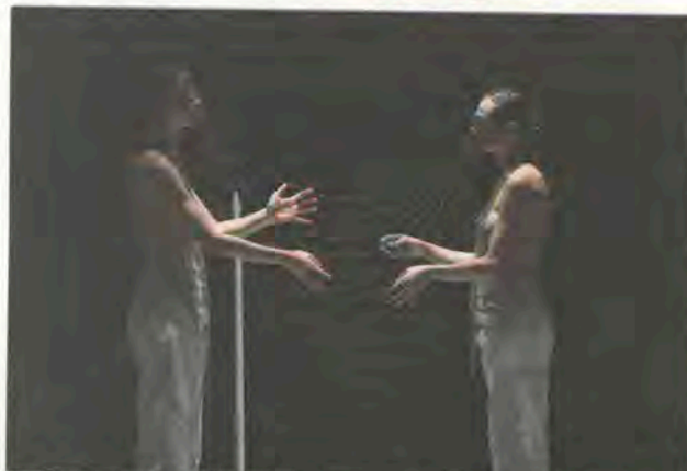
Dans le pays d'hiver, tout en délicatesse souffreteuse.

DANS LE PAYS D'HIVER m.s., scénographie et adapt. de SILVIA COSTA MC93, Bobigny (93). Jusqu'au 24 novembre.