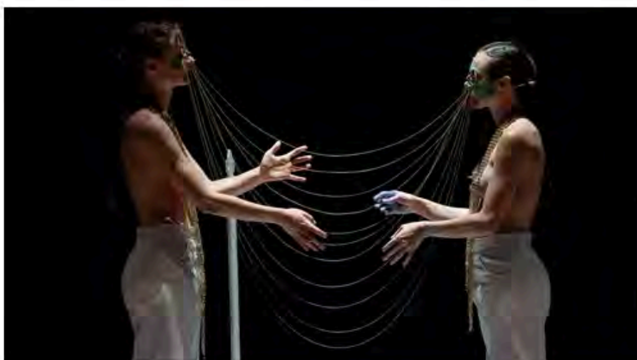
Dans le pays de l'hiver

Tarif préférentiel de 16€ au lieu de 25€ avec le code ALTRITALIANI