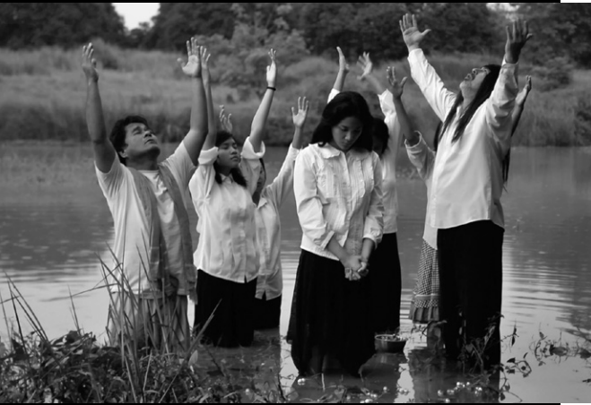
Century of Birthing, 2011

Né aux Philippines le 30 décembre 1958, Lavrente Indico Diaz grandit à Cotabato, Mindanao, sous le règne de Ferdinand Marcos et dans les années sanglantes de la loi martiale. Après des études d'économie et de droit, il signe des scénarios et réalise ses premiers courts-métrages au milieu des années 1980. Il s'installe aux États-Unis en 1992 où, deux ans plus tard, il entame en 16 mm son premier long-métrage. Achevé dix ans plus tard alors qu'il partage sa vie entre New York et les Philippines, Evolution of a Filipino Family (2004) lui vaudra, avec Batang West Side (2001) et Heremias, Book One: The Legend of the Lizard Princess (2006), une reconnaissance internationale. Death in the Land of Encantos (2007) et Melancholia (2008) sont tous deux récompensés à la Mostra de Venise. En 2009, il est sélectionné pour réaliser un segment du Jeonju Digital Project, Butterflies Have No Memories . Suivent Century of Birthing (2011), Florentina Hubaldo, CTE (2012), et Noite, the End of History (2013) qui figure dans la sélection « Un certain regard » du Festival de Cannes. En 2014, il remporte le Léopard d'or au Festival international du film de Locarno pour From What Is Before . Lav Diaz achève actuellement un film consacré à l'assassinat de la figure fondatrice de la révolution philippine, Andres Bonifacio, par son rival Emilio Aguinaldo, qui devint le premier président du pays en vendant aux États-Unis son indépendance tout juste conquise.