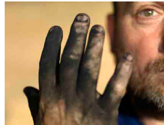
Le Cahier d'argile , Isaki Lacuesta, 2011

En 1988, l'artiste Miquel Barceló fait un voyage dans le désert du Sahara, de l'Algérie jusqu'au Mali. Sa peinture et sa vie en sont totalement changées. Il décide d'installer un atelier au Mali où il passe de longues périodes. Les œuvres qu'il y a créées sont connues dans le monde