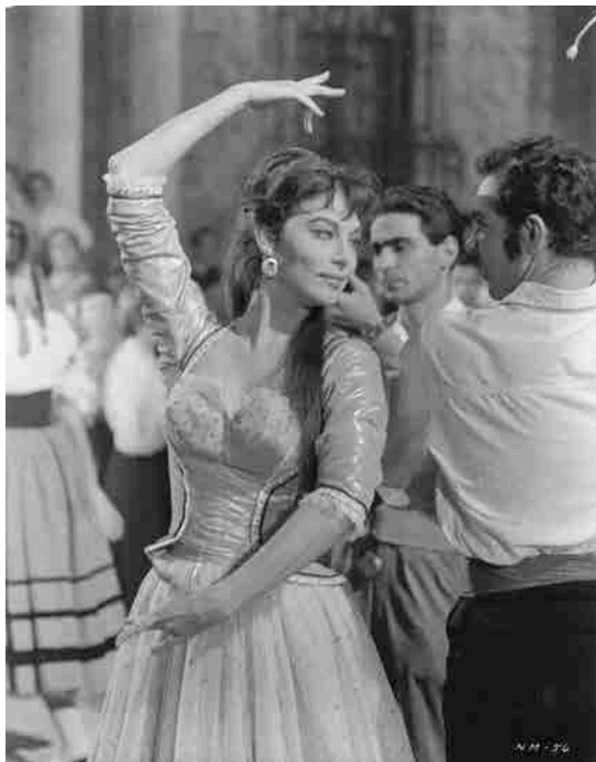
La nuit qui n'en finit pas , Isaki Lacuesta, 2010 © Turner, KaBoGa, TCM Original, La Termita Films

Fondé sur le roman de Marcos Ordóñez, Beberse la vida : Ava Gardner en España , ce documentaire mène deux enquêtes de front : l'une suit les traces de la star dans l'Espagne franquiste des années 1950, où elle tourna plusieurs films et s'installa ; l'autre fait l'histoire d'un corps, d'un visage filmé grâce à un travail dialectique sur les images.