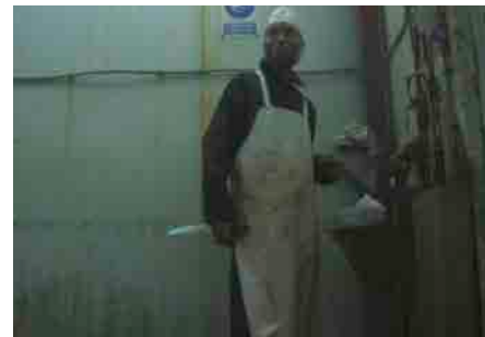
Le Rite , Isaki Lacuesta, 2010

Dimanche 16 décembre, 20h, Cinéma 2 Samedi 29 décembre, 15h, Cinéma 2