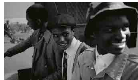
Les Images échos , Isaki Lacuesta, 2018 © Isaki Lacuesta

Pour introduire à son installation, Les Images échos , et nous mener jusqu'à elle, le cinéaste expose ici retours, symétries, oppositions et jeux de miroir, en rapprochant deux à deux des images de ses films.