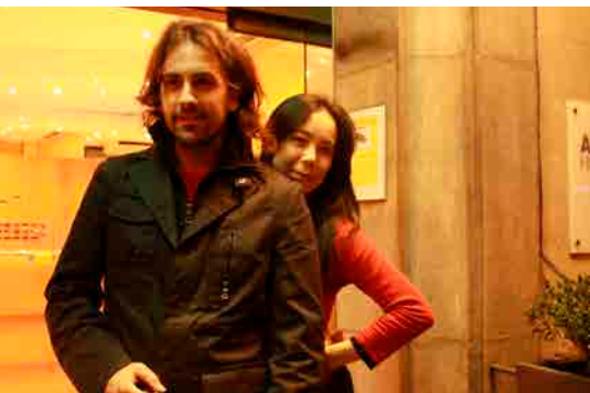
Isaki Lacuesta et Naomi Kawase, 2008