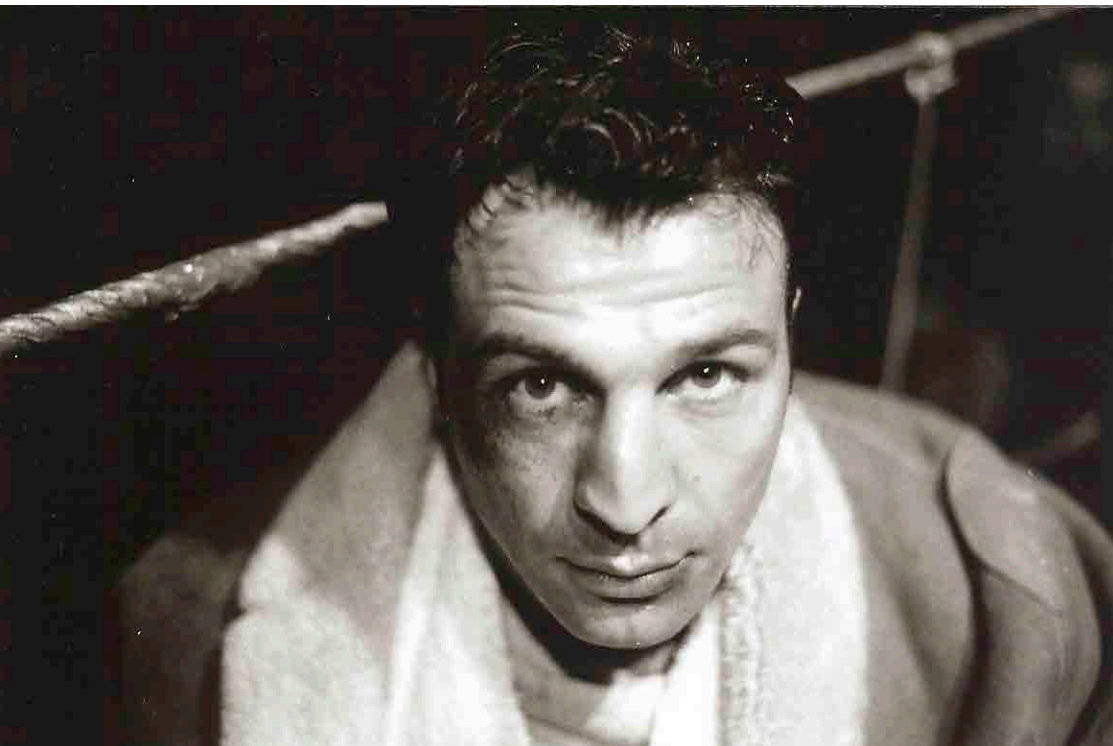
Cravan vs. Cravan , Isaki Lacuesta, 2002