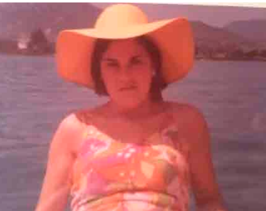
La Répétition, Banyoles 82 , Isaki Lacuesta, 2012 © La Termita Films