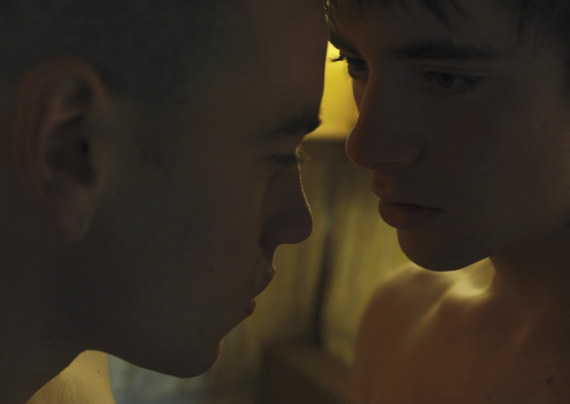
Peau neuve , Isaki Lacuesta et Isa Campo, 2016 © La Termita Films, Corte Y Confeccion De Peliculas, Sentido Films, Bord Cadre Films