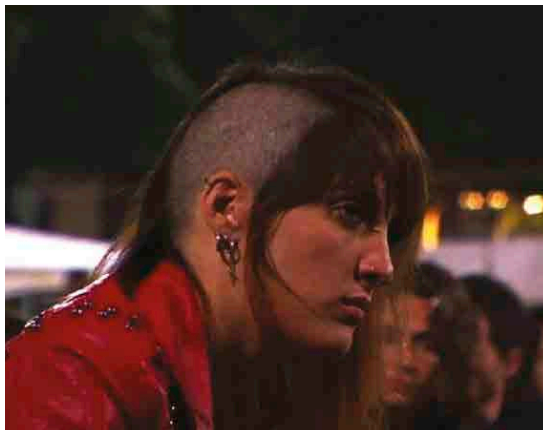
Le Sacrifice du cochon , Isaki Lacuesta et Pep Armengol, 2010

Dimanche 2 décembre, 15h, Cinéma 2, en présence du cinéaste Dimanche 16 décembre, 17h, Cinéma 2