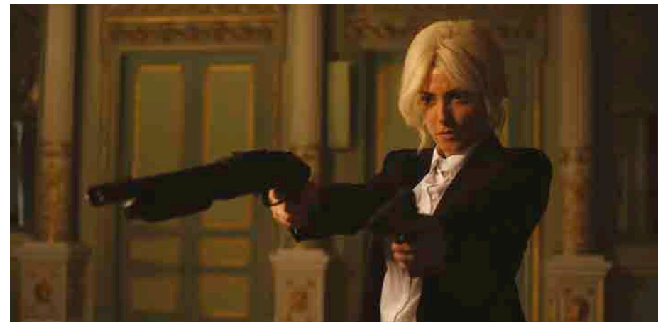
Ils moururent au-dessus de leurs moyens , Isaki Lacuesta, 2014 © La Termita Films, Alicorn Films, Sentido Films

Judi 13 décembre, 20h, Cinéma 2 Mercredi 26 décembre, 20h, Cinéma 2