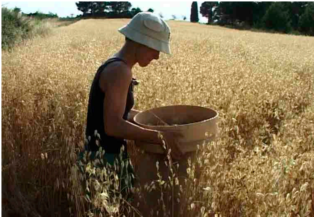
Soldats inconnus, Isaki Lacuesta et Pere Vilà, 2008