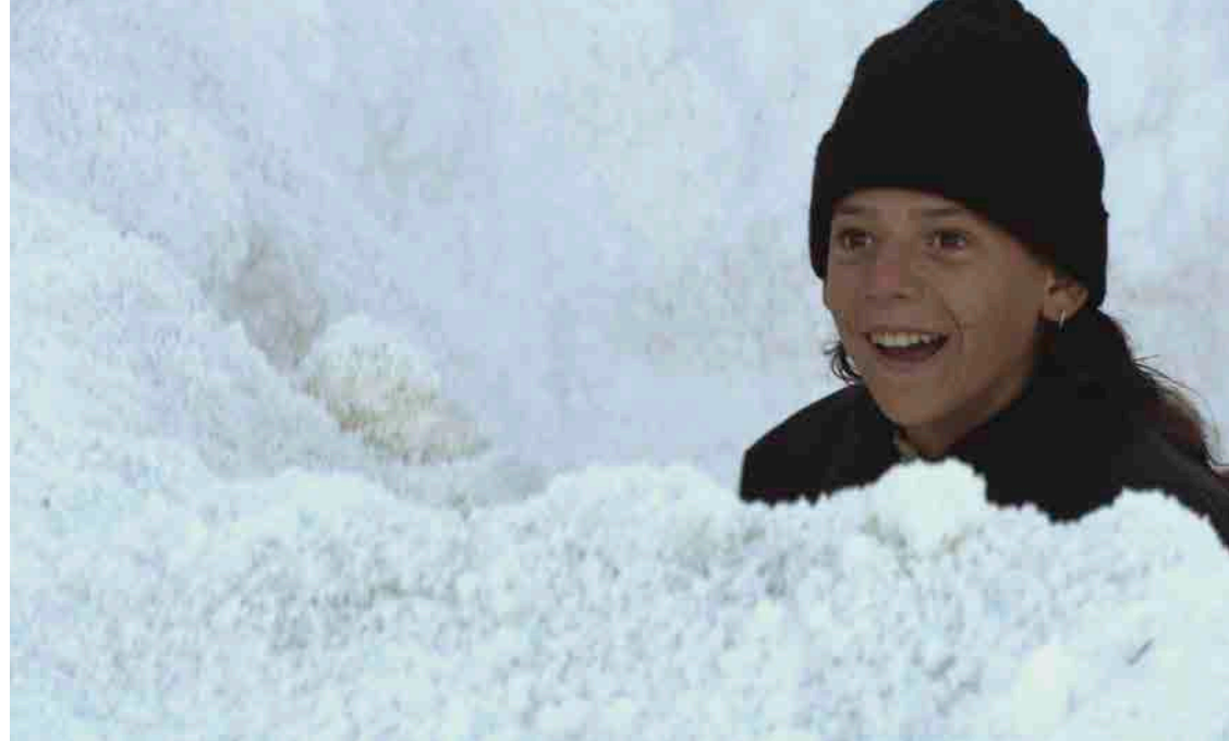
La Leyenda del tiempo, Isaki Lacuesta, 2006

Vendredi 30 novembre, 20h, Cinéma 2, en présence du cinéaste