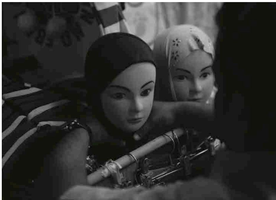
Où en êtes-vous, Isaki Lacuesta ?, Isaki Lacuesta, 2018