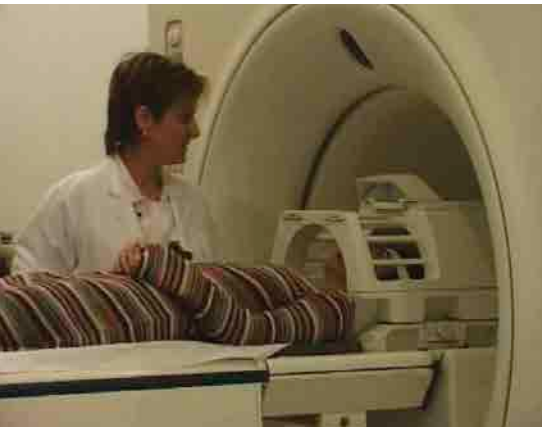
Résonances magnétiques, Isaki Lacuesta, 2003 © La Termita Films, Benece Produccions, Anemic Cinema