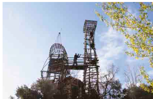
L'Inventeur de la jungle, Jordi Morató, 2014