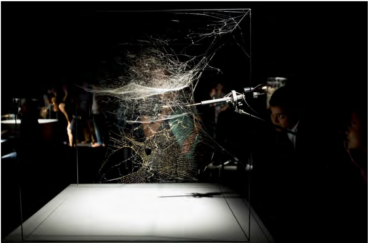
Tomás Saraceno, Singapour © Studio Tomás Saraceno, 2015