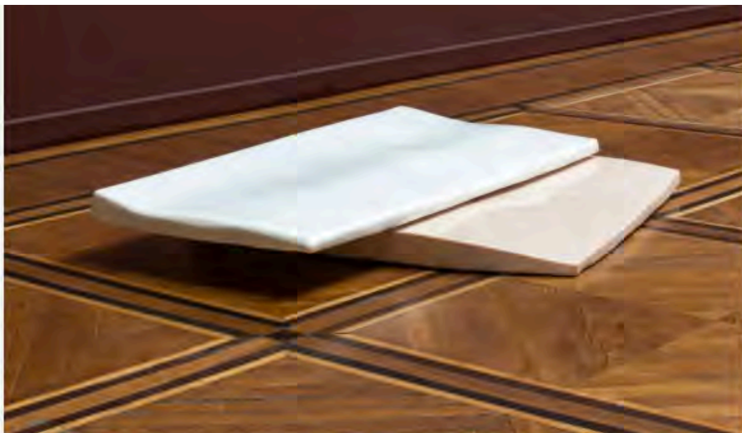
Nairy Baghramian, Maintainers , a detail, Palais des Beaux-Arts

For Baghramian, the spectacular is a pointed moment where the relationship between visibility and invisibility turns into liminal masses. In some instances, the previously-invisible materializes, as with the grainy, unfinished appearance; elsewhere, the fugitive quality of a darkness milestone shades into imperceptibility.