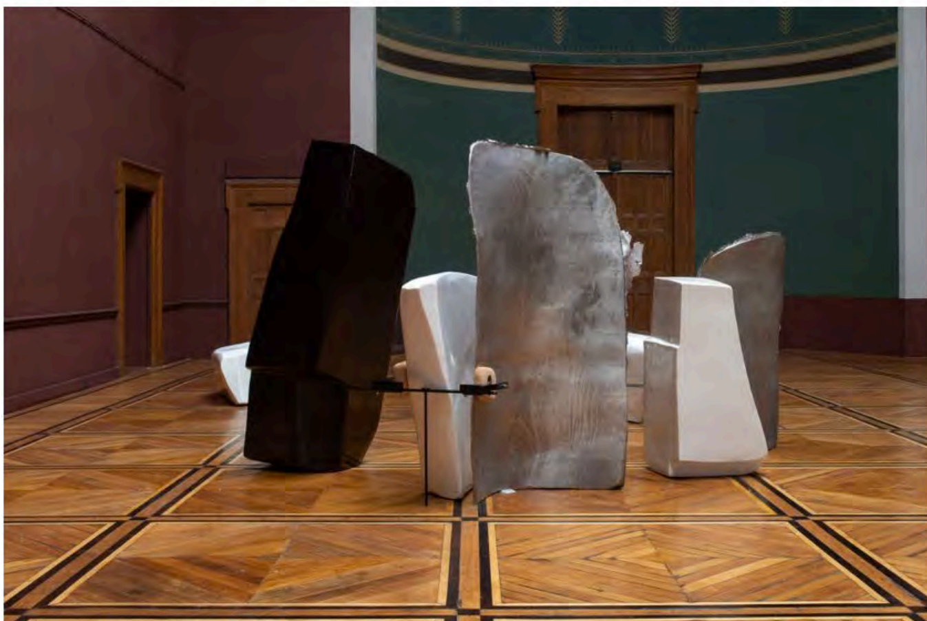
Nairy Baghramian, Beaux Arts, octobre 2018, Festival d'Automne

Une exposition : Nairy Baghramian, interroge les problématiques de la fonctionnalité, de la décoration, de l'abstraction et du féminisme.