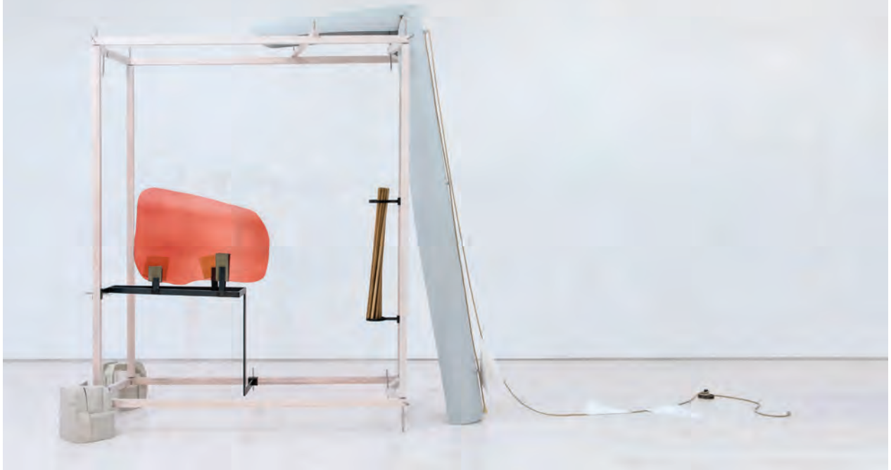
Drawing Table (Homage to Jene Bowles), 2017 Installation view, Documenta 14, Athens, April 8 - July 16, 2017. Artist inventory #NB457

NAIRY BAGHRAMIAN , plasticienne d'origine iranienne vivant à Berlin, présente ses sculptures aux Beaux-Arts de Paris. Une première exposition française construite dans une troublante instabilité.