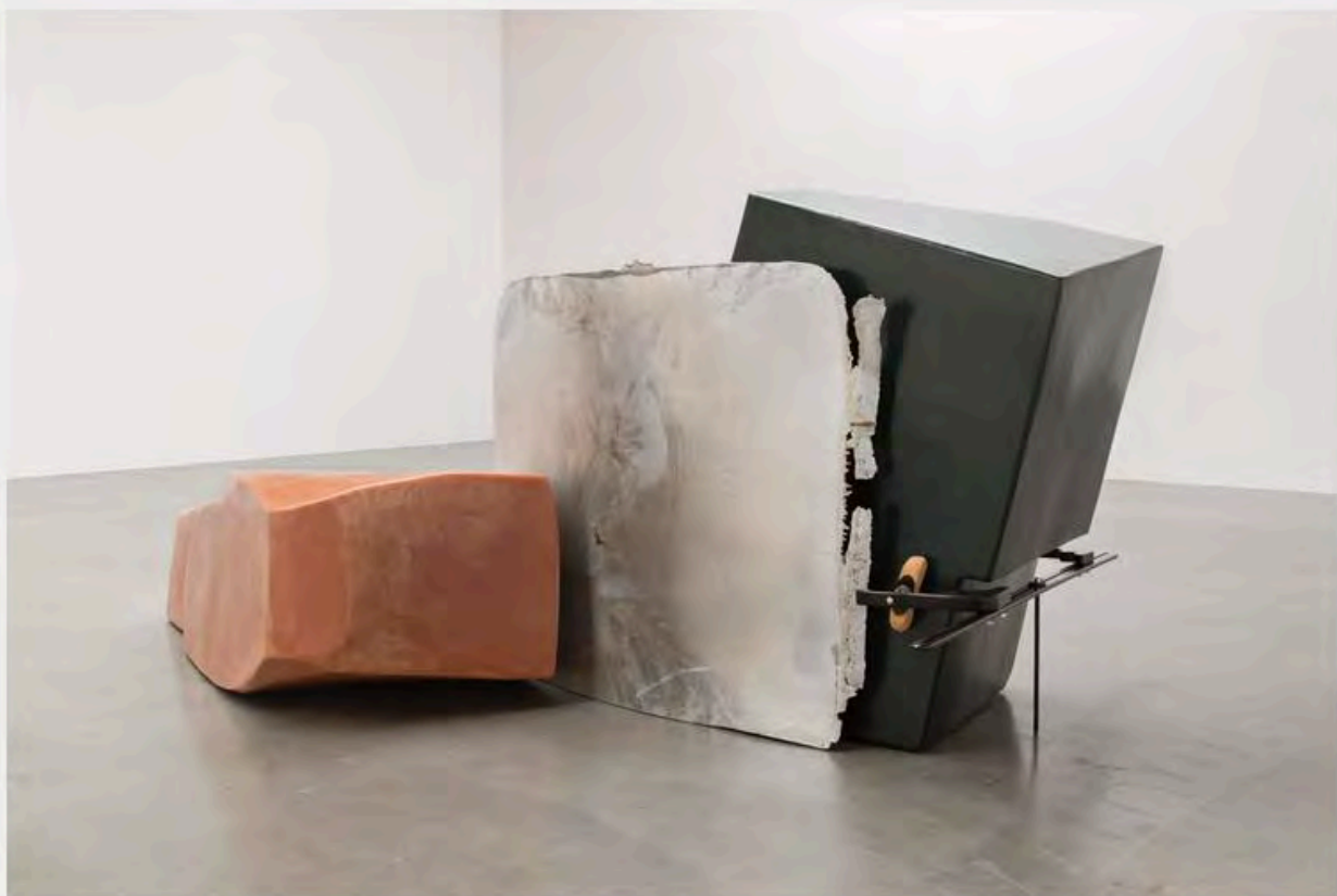
nairy baghramian, installation view maintainers , kurimanzutto, mexico city, 2018.

nairy baghramian in festival d'automne - maintainers beaux-arts - paris october 13, 2018 - january 6, 2019