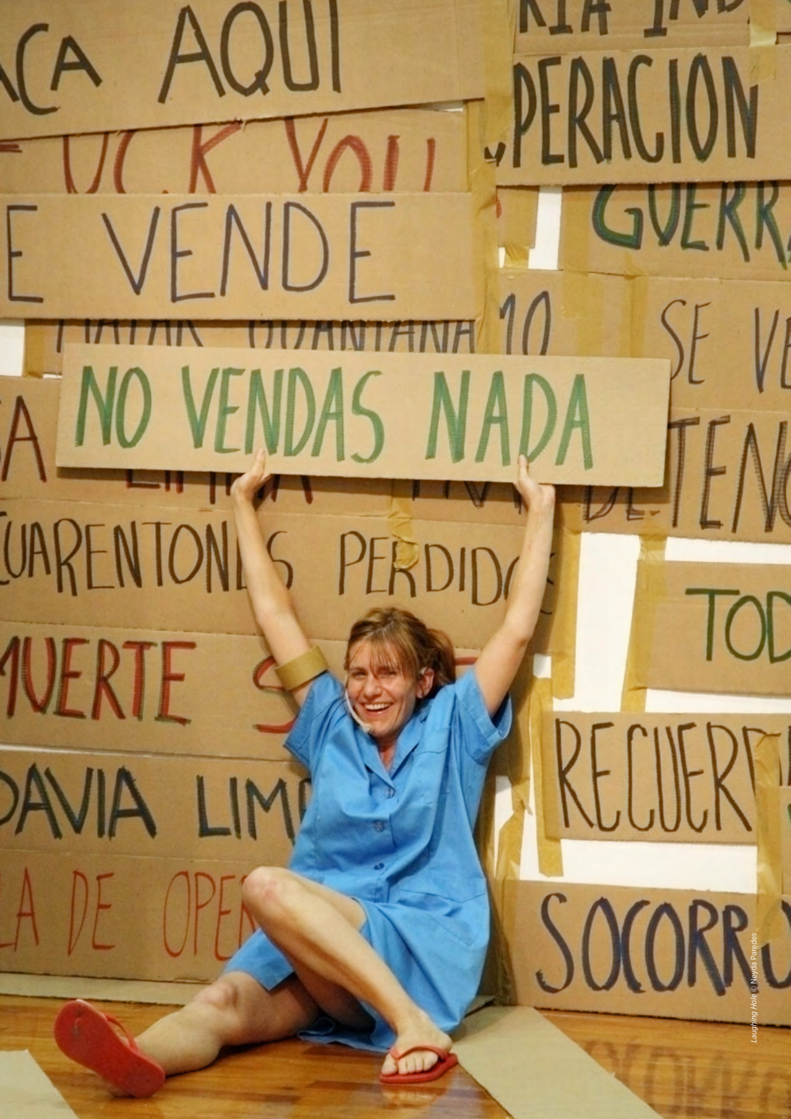
Laughing Hole