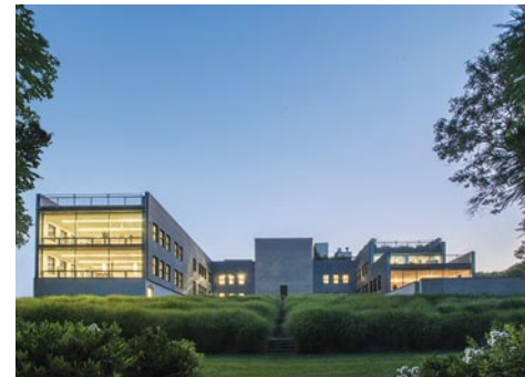
Watermill Center

Créé en 1992 par l'artiste visionnaire Robert Wilson, The Watermill Center est un laboratoire interdisciplinaire pour les arts et les sciences humaines s'étendant sur quatre hectares à l'extrémité Est de Long Island sur des terres ancestrales des indiens Shinnecock et qui propose toute l'année des résidences d'artistes et des programmes éducatifs. En mettant l'accent sur la créativité et la collaboration, Watermill relie les pratiques d'art contemporain aux savoirs des sciences humaines et aux recherches scientifiques pour fournir à une communauté internationale le temps, l'espace et la liberté de créer et d'inspirer.