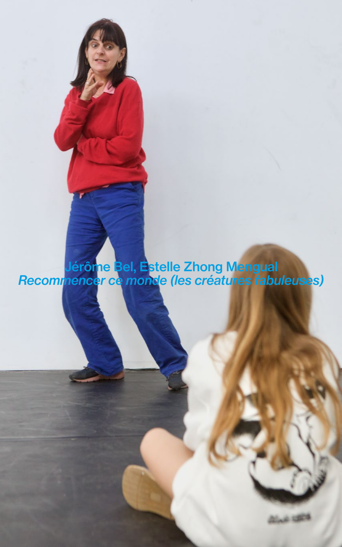
Jérôme Bel, Estelle Zhong Mengual Recommencer ce monde (les créatures fabuleuses)